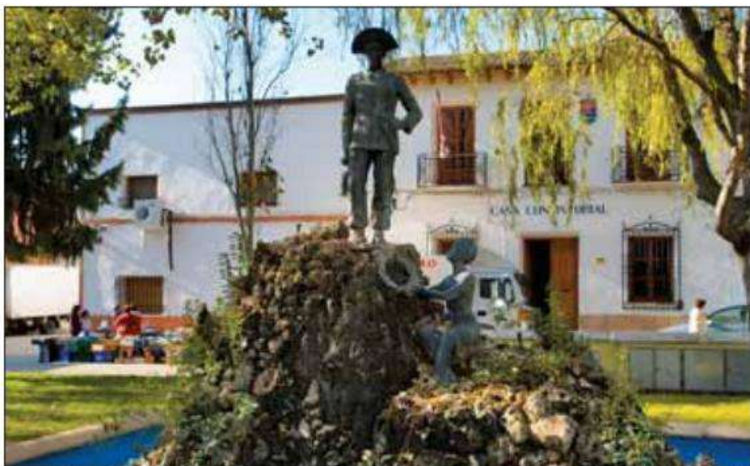
Junto al Ayuntamiento de Osa de la Vega (Cuenca), destaca el monumento dedicado a Gregorio Catalán Valero, nacido en la localidad y héroe de Baler (Filipinas).