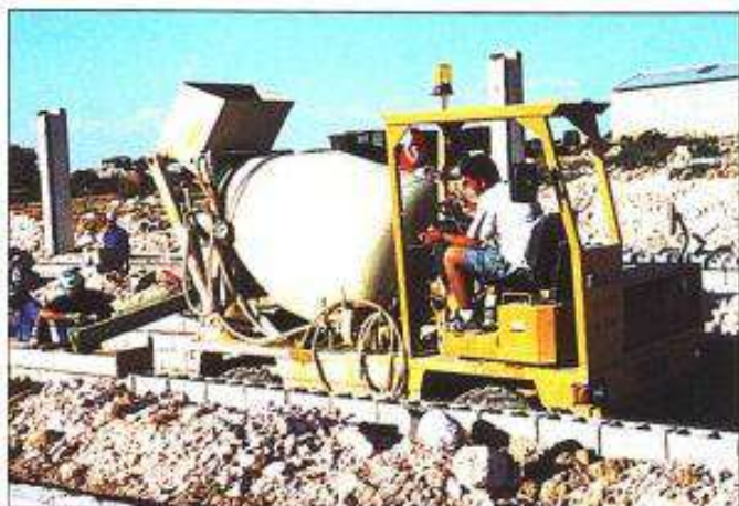
Las obras de esta granja se desarrollan con rapidez junto a la localidad