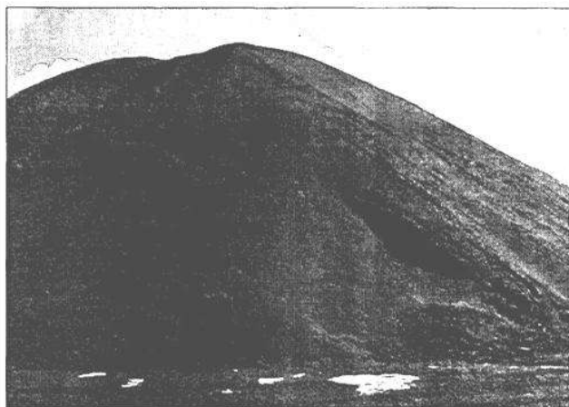
Los purines son los residuos que se generan en las granjas de porcino.

La empresa autorizada en exclusiva para la comercialización de este proceso en Europa es Depuraco Integral S.A.