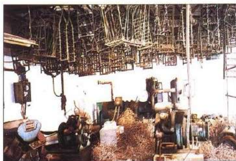
Los equipos compresores de aire se encuentran abandonados en el exterior del recinto, rodeados de maleza y de otros materiales que antes eran empleados en la factoría.