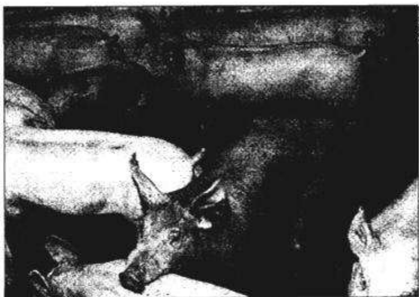
Las granjas de porcino generan una importante cantidad de purines.

El proyecto empresarial que se está desarrollando por parte de Decoinsa en Osa de la Vega viene contemplado en el Real Decreto 20/18 /98 de 30 de diciembre que permite el desarrollo de este tipo de proyecto de investigación a través de los cuales se supriman del medio ambiente los residuos que generan las granjas de cerdos de Monte de Belén y Monte de Pilar. La inversión total que supone la ejecución de este proyecto asciende a 11,4 millones de euros, unos 1.900 millones de pesetas que ha asumido en su integridad la empresa promotora y sin ninguna ayuda de las administraciones públicas a pesar de estar considerada la región objetivo 1 por parte de la Unión Europea.