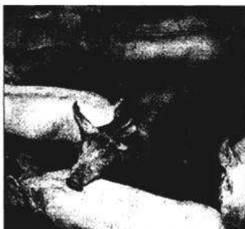
Exporinsa está dentro del sector porcino desde 1995.

Dentro de la filosofía de Exporinsa, está la "máxima sanidad igual a óptima producción", siendo éste uno de sus lemas, y así queda reflejado en las explotaciones que la empresa posee en el territorio nacional."