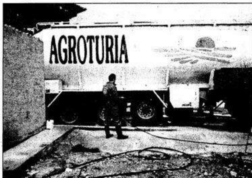
Agroturia aporta a la explotación el ganado, el pienso, los medicamentos y el servicio técnico.

https://ceclmdigital.uclm.es/viewer.vm?id=0001396177&page=28&search=