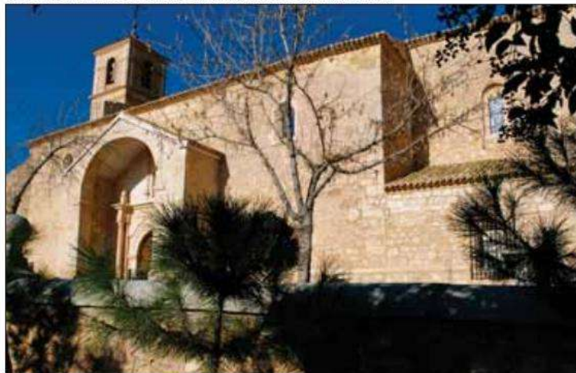
Iglesia Parroquial de Nuestra Señora de la Asunción en Osa de la Vega (Cuenca).

https://ceclmdigital.uclm.es/viewer.vm?id=0000182979&page=31&search=